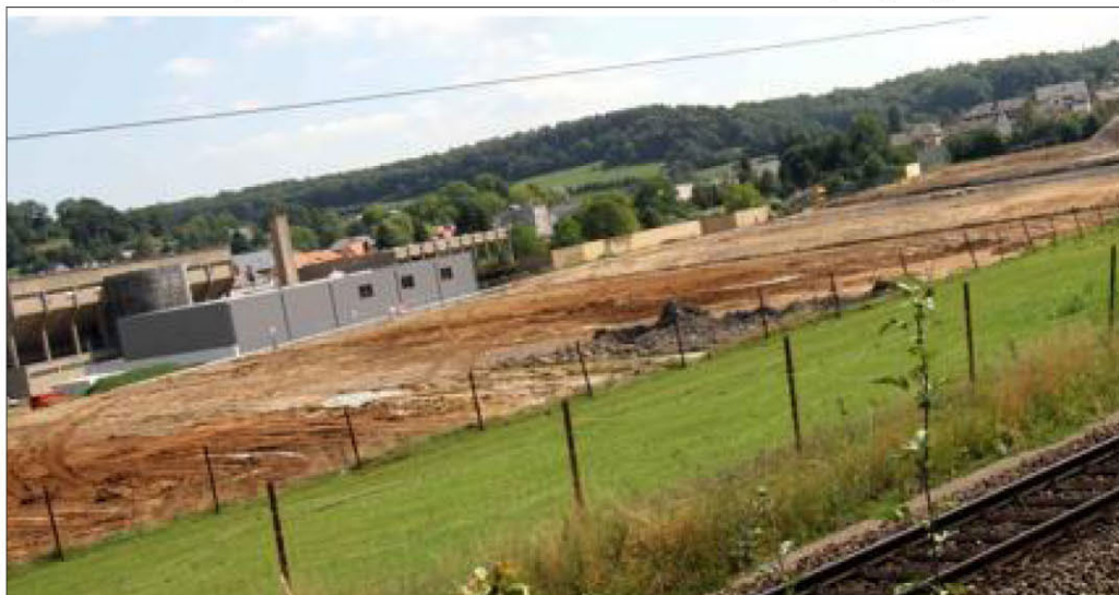
Le nouveau complexe Aquasud prendra place à proximité de l'actuelle piscine en plein air de Differdange. Les travaux vont débiter à la fin du mois d'août.